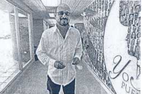
A partir del 1 de septiembre, el alcalde hatillano comenzó a cobrar seis mil dólares mensuales, obteniendo un aumento de dos mil dólares.

cesión económica, lo cual ha puesto en peligro la calidad de los servicios que debe recibir la ciudadanía", afirmó el senador penepe.