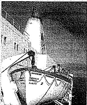
El Ferry también está disponible para eventos corporativos

La embarcación, la cual fue recientemente remodelada con una inversión de $2 millones y cuenta con casino, áreas de juegos para niños, servicio de Internet y restaurante, también promociona una tarifa ida y vuelta de San Juan a Santo Domingo por $253 por persona. Las ofertas que incluyen un camarote para cuatro personas, comienzan en $267 por persona.